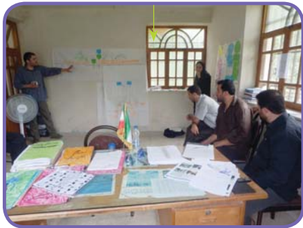
جلسه برنامه‌ریزی درباره خسارت دام