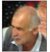
برار گل ایلچی