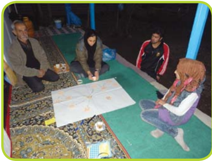
آشنایی با نقش دام در زندگی مردم در منزل آقایان بروهان

همان طور که روی خط زمانی پایین می‌بینید، سال گذشته حدود تیرماه بود که ما وارد روستا شدیم. در پنج ماه اول سعی کردیم بیشتر زندگی مردم و رابطه‌اش با طبیعت را بشناسیم. متوجه شدیم در این رابطه مشکلاتی مثل مشکل خسارت دیدن گاو وجود دارد. برای همین از دی ماه ۹۱ نشست‌هایی با مردم داشتیم و درباره مسئله خسارت دیدن گاو صحبت کردیم. متوجه شدیم این مسئله به همه مردم ربط دارد و برای همین لازم